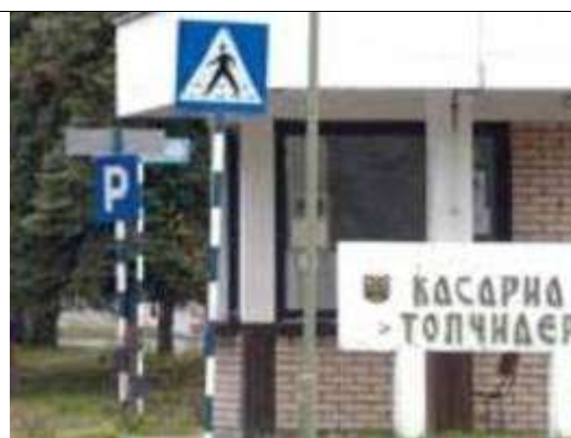
Na slici: Stavba zveznoga sekretariata za narodno obrambo in »prijavnica« na Topčiderju,