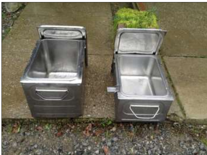
Slika: Hrano so dovažali in nato razdeljevali iz takih posod.

Izkoristil bom izkušnjo iz Pančeva – vlak Emona express ob 16.00 iz Beograda s prihodom v Ljubljano ob 22,15 in povratek avtobus Niš ekspres (Jesenice – Skopje) ob 20.45. s prihodom v Beograd ob 6.30. Zares prvovrstna in preizkušena kombinacija.