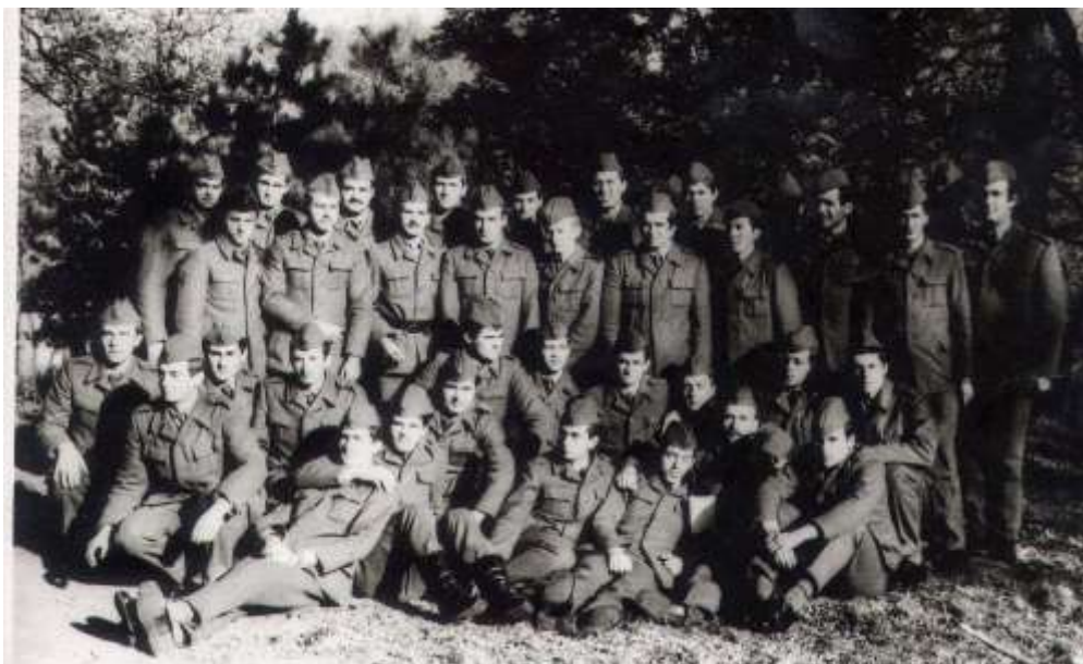
Beograd, torek 16. november 1976

Zdaj se res že krepko bliža konec ampak še vedno ne vem kdaj točno se bo to zgodilo. Kapetan o tem ne govori, tu pa tam še vedno omeni manever, meni pa je nerodno, da bi ga spraševal. Civilna obleka je zložena v omari, ne taki, kot smo jo imeli v Bileći, v taki pravi kot smo jih navajeni doma. Ne želim si je niti pogledati, saj me vsakič znova stisne pri srcu. Po vseh mojih izračunih bi lahko šel domov v ponedeljek, po malem pa računam, da bi me kapetan lahko spustil že v petek za vikend.